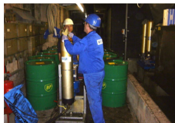
Spülung des Schmieröl- und Steuerölkreises einer Bandwalzanlage