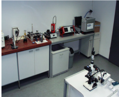
Stationäres Labor in Pulheim