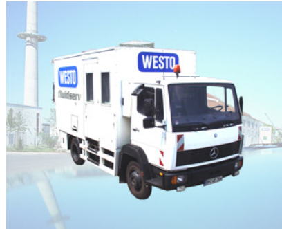
Mobiles Labor „Fluidserv“